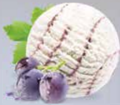
Grappa la Ticinella