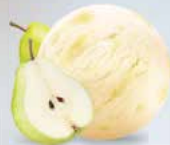
Birnen Sorbet lactosefrei