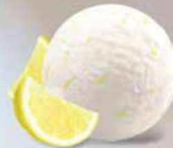
Zitronen Sorbet lactosefrei