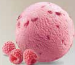
Himbeer Sorbet lactosefrei